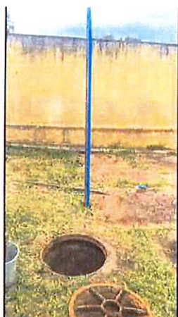
“Respiro” da rede de adução/distribuição

Cumpre informar que foi realizada vistoria e constatado um vazamento que ocorria esporadicamente no respiro da saída da rede de abastecimento do reservatório Suíça. Foi executado o reparo dessa tubulação sanando o vazamento. Foi executada inspeção predial no interior do reservatório sem observância de qualquer problema que poderia ocasionar vazamentos.