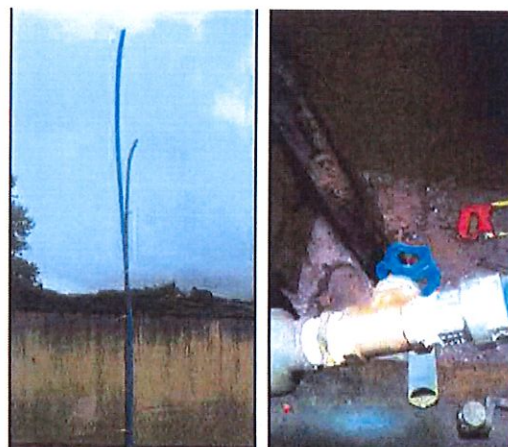
Parte interna quebrada e substituída