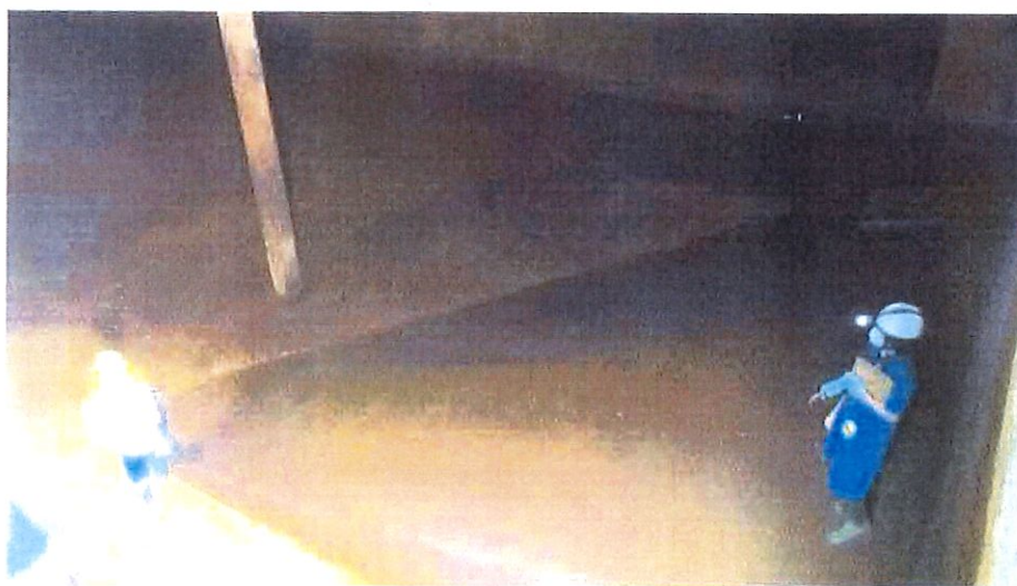
Avaliação Predial Interna Reservatório Suíça