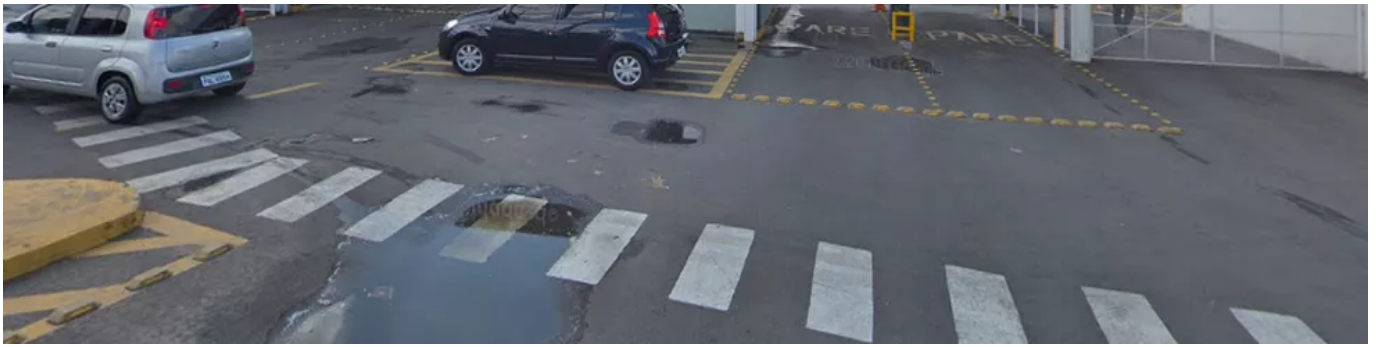
Fachada do Centro Universitário Faculdade de Medicina do ABC (FMABC), administrado pela Fundação do ABC, em Santo André, na Grande São Paulo

A Secretaria da Saúde de Santo André anunciou que pretende levar o que apurou para os órgãos competentes, como a Polícia Civil e o Ministério Público de São Paulo.